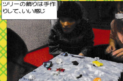
ツリーの飾りは手作りして、いい感じ