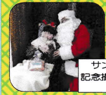
サンタさんと記念撮影