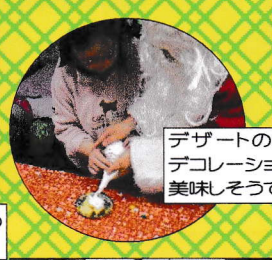
デザートプリンデコレーション。美味しそうですね。