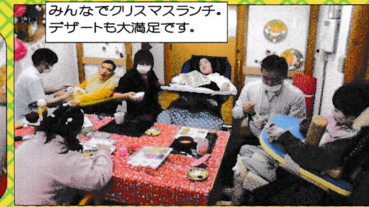
みんなでクリスマスランチ。デザートも大満足です。