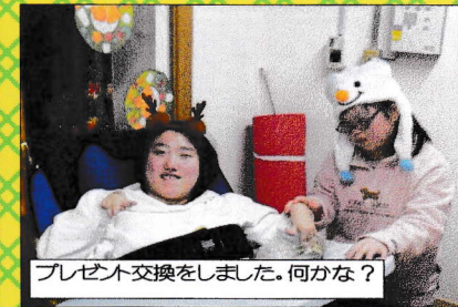
プレゼント交換をしました。何かな?