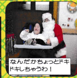
なんだかちよつとドキドキちゃうわ!