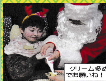
クリーム多めでお願いね!