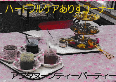
アフタヌーンティーパーティー

皆さまからいただいたご寄付は法人の活動のため、障害児者の支援のために大切に使用させていただきます。