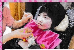
おっ?大人の味 桜ほろじ茶