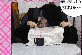
スペシャル画像 管理者様方のテーブルクロス引き!結果は!?