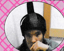
「おだいりさ〜まとおひなさま〜」にナリキリですよ!