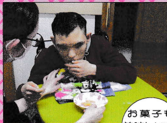
お菓子も美味しいですねえ...

すっかり暖かくなり、豪雪がウソのように雪解けが進みました。少しずつ散歩の回数も増え、春の日差しが部屋の中にも届くようになってきました。前半はひな祭りパーティーで、デコレーションプリンを味わいました。そして年度末、初めてのアフタヌーンティーパーティー。英国式に挑戦してケーキスタンドを準備。職員手作りのチョコムースなど、選べるお菓子にしたつづみ。ルピシアの桜ほろじ茶は大人の味で、感想は人それぞれでしたが、いつもと違う雰囲気を楽しみ、部屋中が桜の良い香りに包まれたひと時でした。