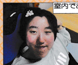
室内でお花見です。