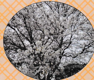
屋外が気持ちいいわ!