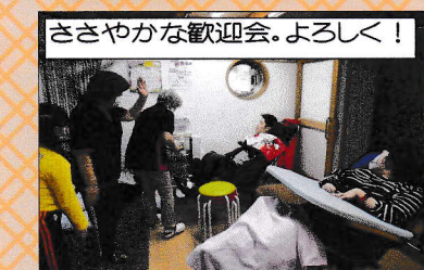
ささやかな歓迎会。よろしく!