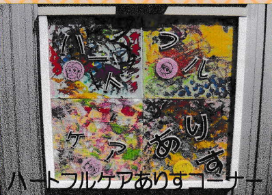
ハートフルケアありすコーナー

昨年度の利用者様4名で制作した「ありす」の看板が施設の外に掲げられました。道路端でとても目立ちます。お近くにお越しの際はぜひご覧ください。