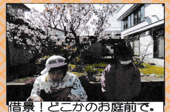
借景!どこかのお庭前で。