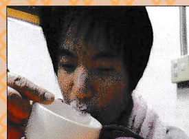
さくらラテのお味は?