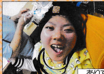
ありすの新しいメンバーです 皆さんよろしくお願ひします。