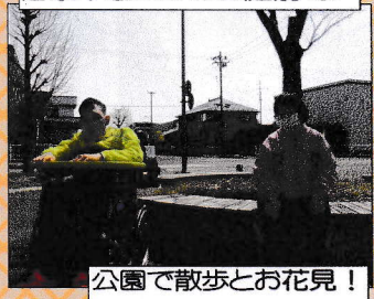
公園で散歩とお花見!