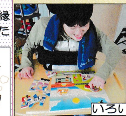
いろいろ楽しい年頃なので…