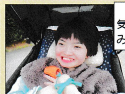
外の空気が気持ちよくて、みんな笑顔！