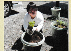
今年もチャレンジミニトマト！