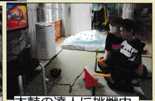
太鼓の達人に挑戦中