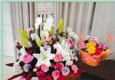
ハートフルケアありすコーナー

※つぶしたり、フィルムをはがす作業は利用者様と一緒にこちらで行いますのでそのまま構いません。