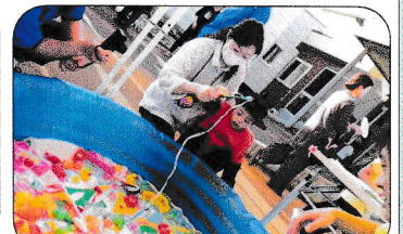
釣れるといいなあ。「むむっ！なかなか難しいぞっ」