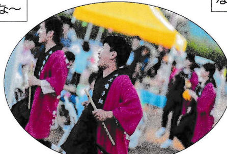
弘大障子組さんが盛り上げる！会場との一体感ハンパない！