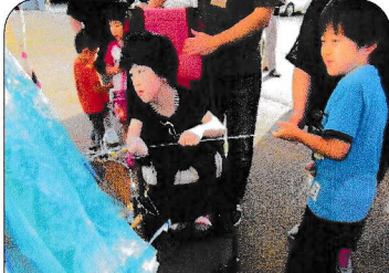
千本引きに挑戦だ！姉弟で力を合わせて～ そ～れ！