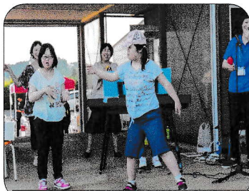
レッツ パプリカダンス♡