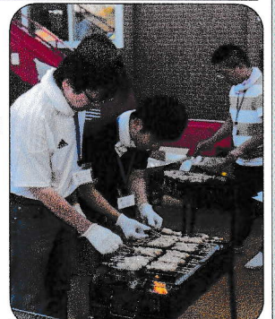
ボランティアさんたち慣れた手つきですね～