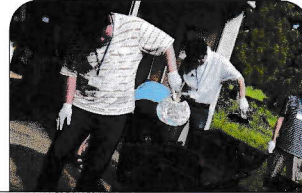
暑い中でしたが、炭火グリルの火おこし作業から！