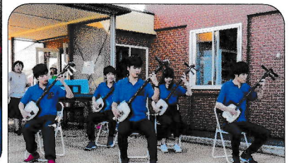
弘大津軽三味線サークルさんの迫力ある演奏！