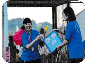
豪華景品ゲットの大抽選会！ 誰に当たるかな～