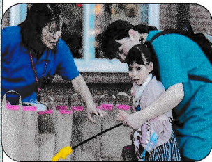
やったあ！いいもの当たっちゃったわ！